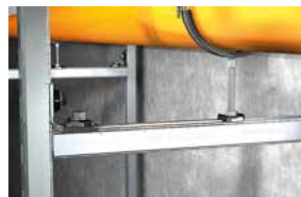
Installazione di tubazioni su telaio