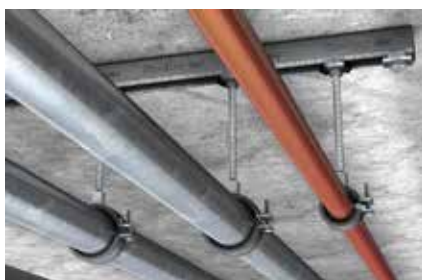
Installazione di tubazioni sui profili FLS